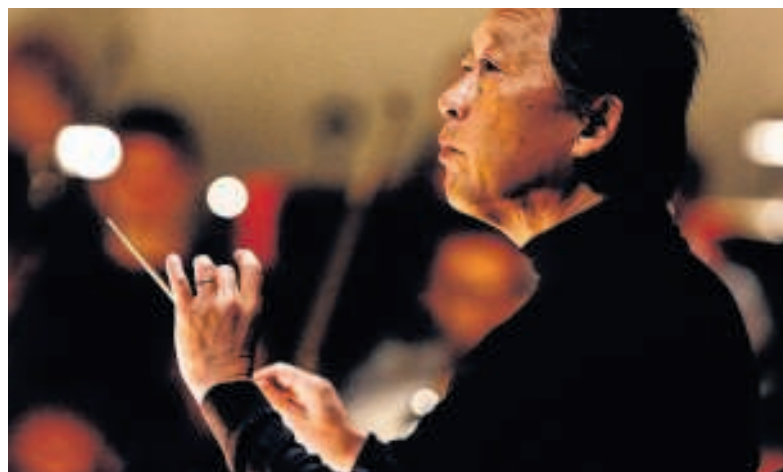
→ Dirigent Myung-Whun Chung is sinds 1984 met regelmaat te gast bij het Koninklijk Concertgebouworkest.