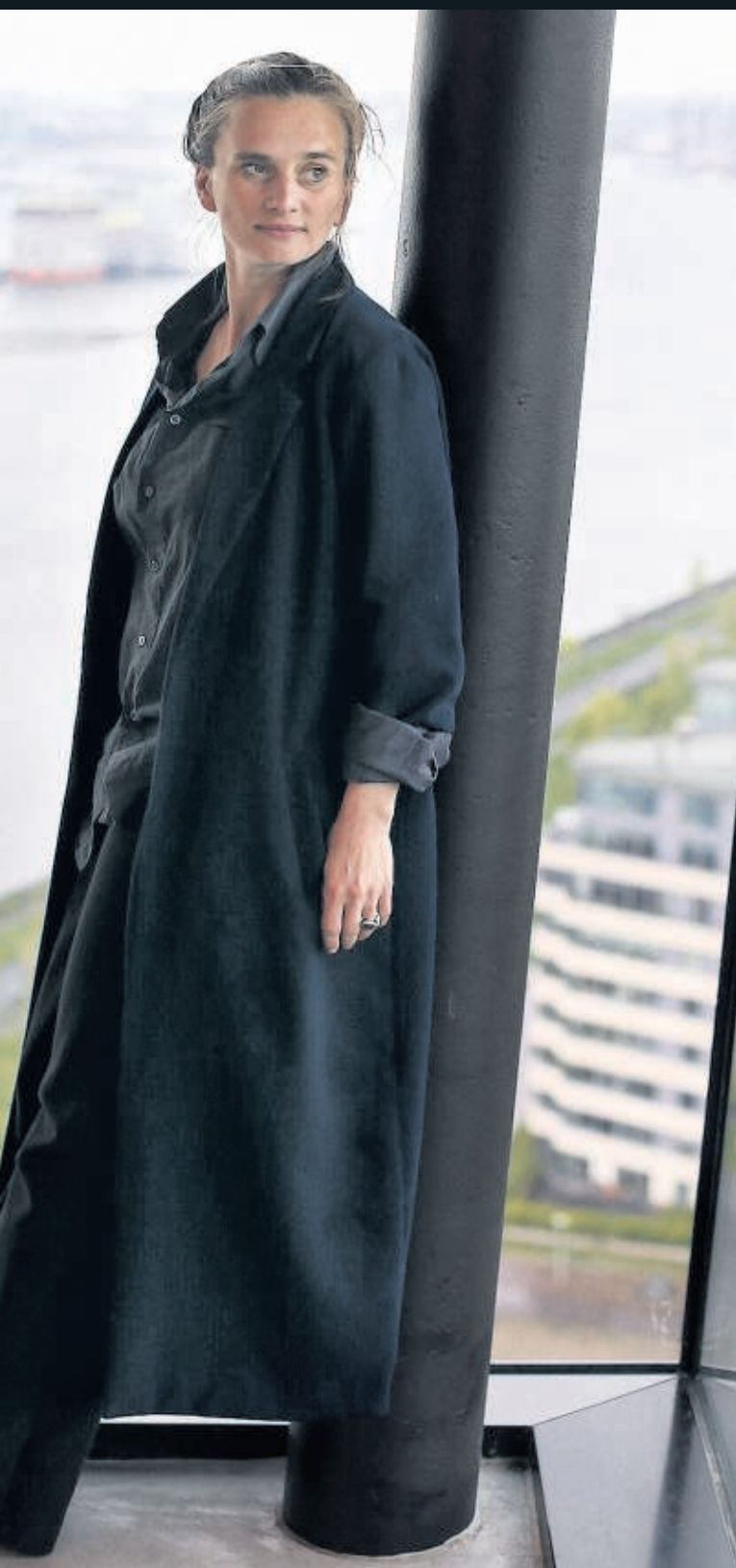
Building Conversation in Amsterdam Noord. Gesprek zonder woorden, vanavond en dan tweewekelijks op donderdag, 19-22 uur, Buikslotermeerplein 15-17; Bevrijdingsgymnastiek, morgen 10-15 uur, NDSM-werf. Info: buildingconversation.nl.